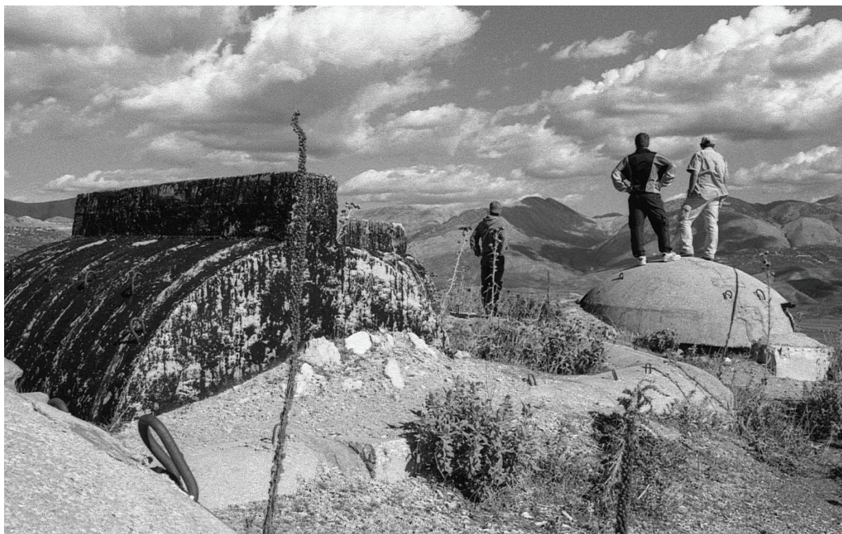
Figura 7 - I bunker sulla collina di Phoinike nei primi anni Duemila.

a pieno diritto nei progetti di ricerca internazionali. Non si va troppo lontano dal vero affermando che tutte le ricerche presentate nei paragrafi precedenti gli sono in qualche modo debitorici.