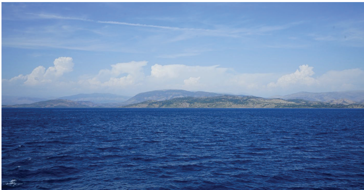
Figura 1 - La costa epirota vista dal canale di Corfù.

confronto scientifico dedicati alla storia e all'archeologia dell'Epiro. In questo senso un merito particolare si deve certamente riconoscere al ciclo di convegni sull'Iliria meridionale e l'Epiro nell'Antichità, inaugurato con grande lungimiranza da Pierre Cabanes, che possiamo considerare a buon diritto uno dei più grandi studiosi di questa regione se non quasi tra i rifondatori della disciplina, intesa con analisi critica della tradizione storiografica epirota anche alla luce dell'archeologia 5 .