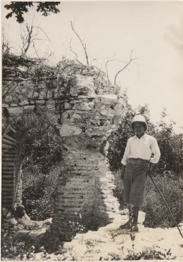
Figura 3 - Luigi M. Ugolini durante gli scavi a Butrinto.

cappella funeraria viene sostituita dal santuario tardoantico, con la chiesa dotata di cripta, ampliato nei secoli successivi (tra fine V e inizi VII sec. d.C.). L'edificio viene rimaneggiato ulteriormente con l'occupazione ottomana e poi parzialmente riutilizzato per costruire un'abitazione, prima di un tentativo di restauro effettuato anche utilizzando elementi lignei. La sequenza è conclusa dalla costruzione della base militare albanese, rimasta in funzione sino agli anni Novanta del secolo scorso. In gran parte della storia del sito, l'acqua gioca un ruolo cruciale, come elemento salutare che attira il pellegrinaggio medievale ma anche come protagonista centrale del paesaggio portuale sottostante. L'altura di Santi Quaranta e il porto di Onchesmos sembrano due poli attrattivi di un popolamento accentrato che sale e scende dalla collina con sorti talvolta alterne e talaltra concomitanti.