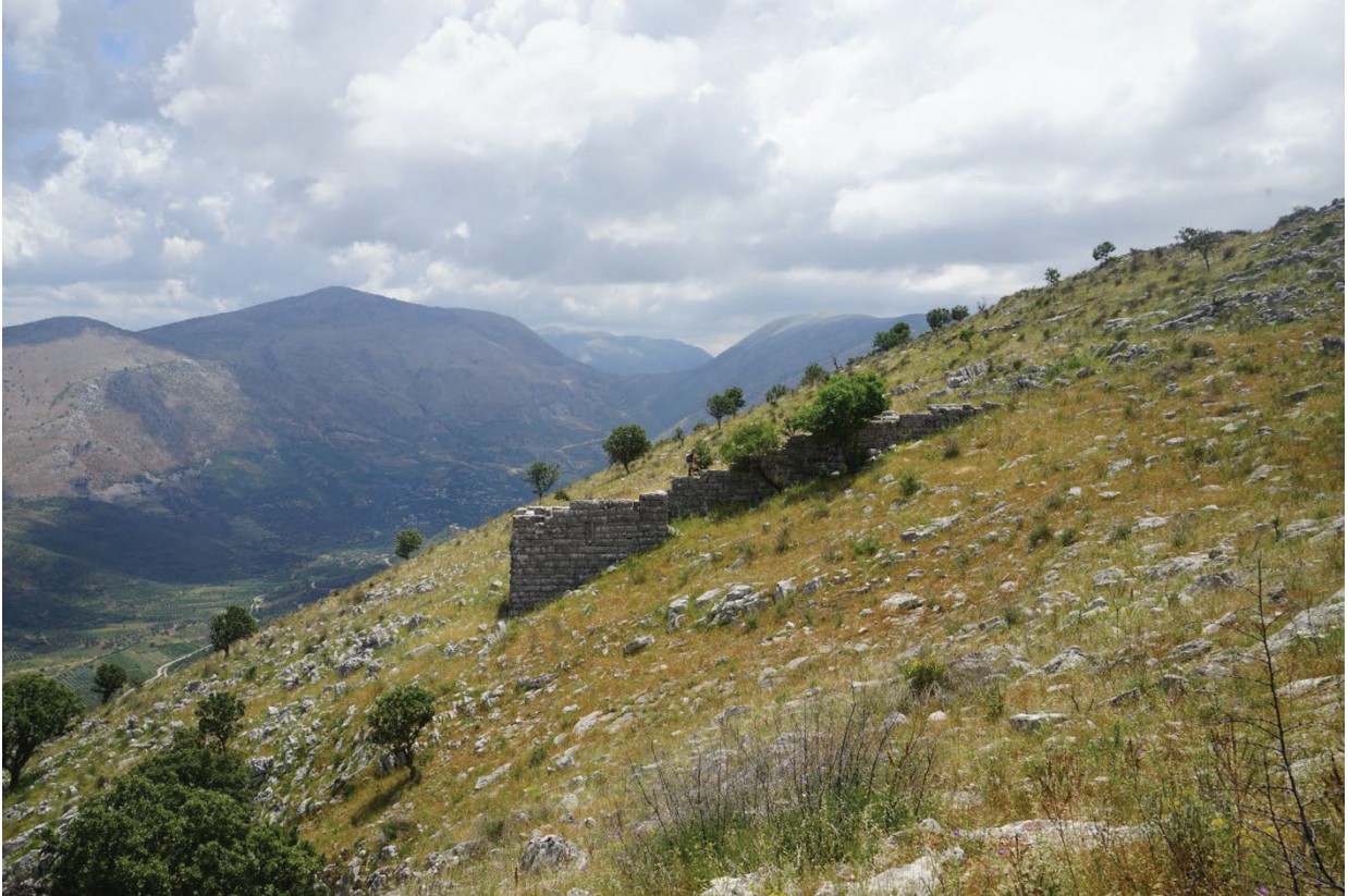
Figura 6 - La torre di Vagalat svetta sulla valle della Pavlla.