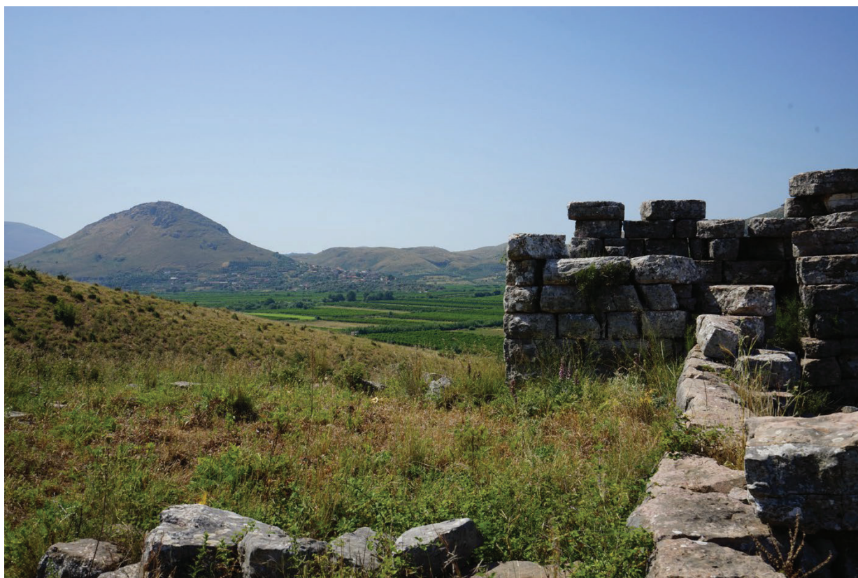
Figura 4 - La collina di Çuka e Ajtoit vista dal vicino sito di Malathre, in primo piano.

Anche nel caso di Çuka e Ajtoit (Figura 4), le nuove ricerche hanno dovuto confrontarsi con una precedente storia degli studi, già avviata nel secolo scorso dallo stesso Ugolini e poi ripresa, a distanza di qualche decennio, da un team di archeologi albanesi guidato da Selim Islami, che operò in un periodo particolarmente delicato per le vicende politiche del Paese delle aquile. L'estrema vicinanza rispetto alla frontiera che ancora oggi separa la Grecia dall'Albania, infatti, rese questo luogo strategico anche per l'esercito, che vi realizzò costruzioni e trincee danneggiando irreparabilmente i resti delle strutture antiche. L'occupazione militare di molti siti d'altura, considerati strategici nell'antichità, nel complesso