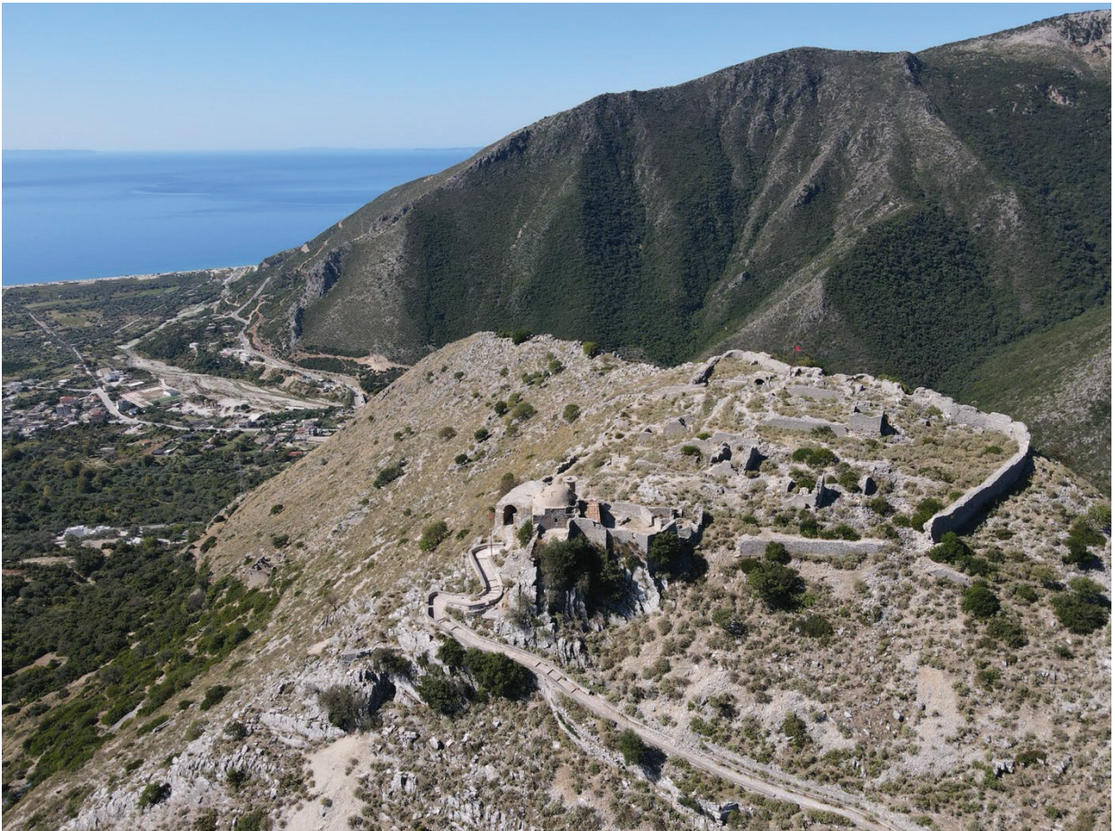
Figura 2 - Il sito di Sopoti, presso Borshi.

Le seguenti due sezioni del volume sono le più corpose e sono dedicate all'archeologia di Butrinto e dei territori costieri di Himara, Borshi, Saranda, Çuka e Ajoit e poi alla regione circostante, con studi e progetti di ricerca sul campo che delineano un quadro territoriale più ampio. La disponibilità e la volontà di condividere informazioni preziose, spesso provenienti da ricerche tutt'ora in corso sul