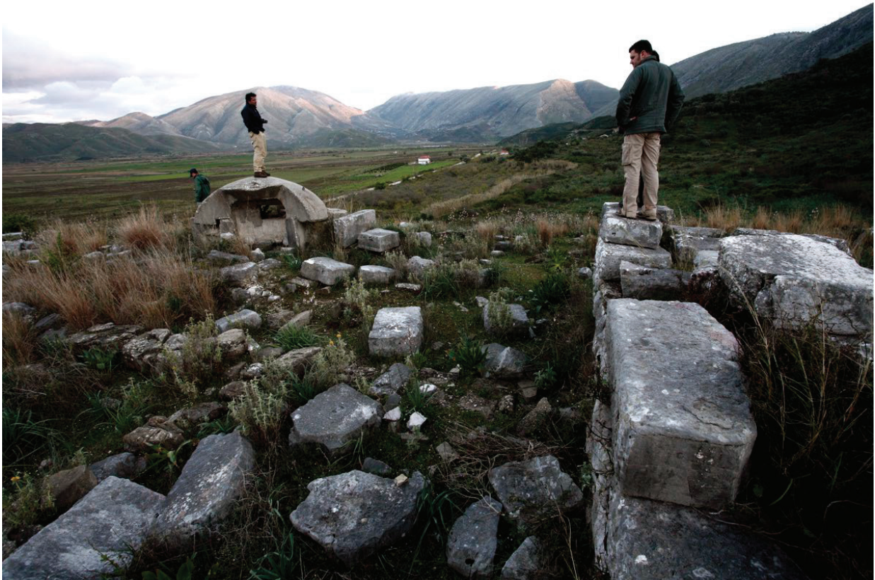
Figura 5 - il bunker presso il sito di Dobra nel 2008.